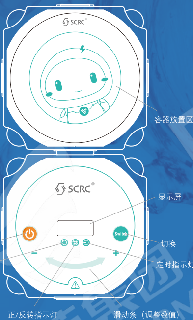
多联磁力搅拌器 (控制器) SCRC-N52D