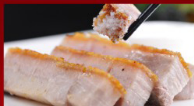
26 脆皮烧肉 ----- 27 Crispy roasted pork belly Rôti de porc croustillant