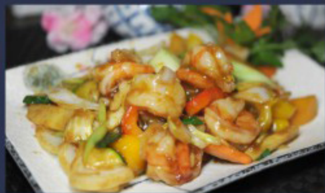
54 杂菜虾 ----- 28 Shrimps stir-fry vegetables Crevettes sautées aux légumes