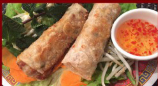
05 越南卷 ----- 8 Vietnamese fried Spring Rolls 2p Rouleaux de printemps Vietnamiens frits with Porc