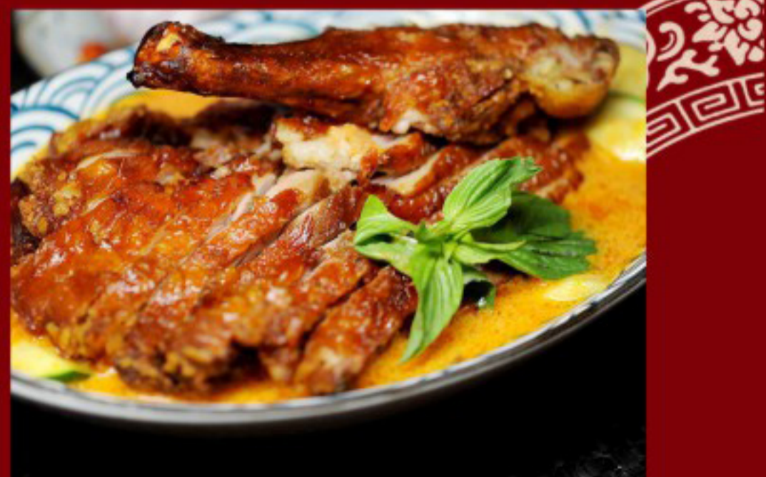
70 红咖喱鸭 Red Curry Duck Canard au curry rouge 35/30(big/small)

图片仅供参考·所有菜品以最终实物为准 Pictures are for reference only to all the dishes in the end in kind