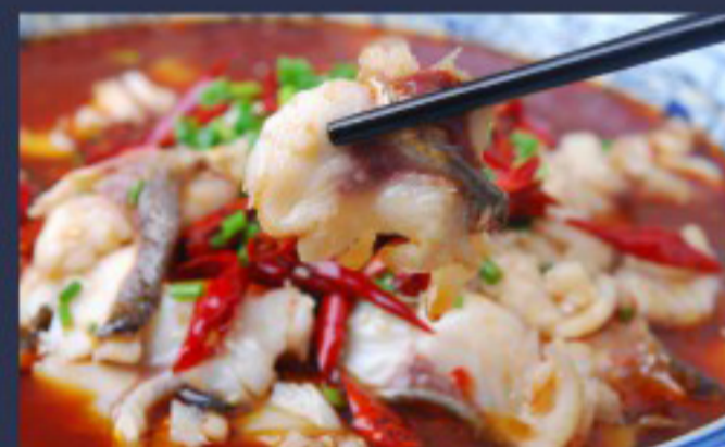
49 水煮鱼 ( ) ----- 30 Boiled fish (chili oil) Poisson bouilli (huile pimenté)