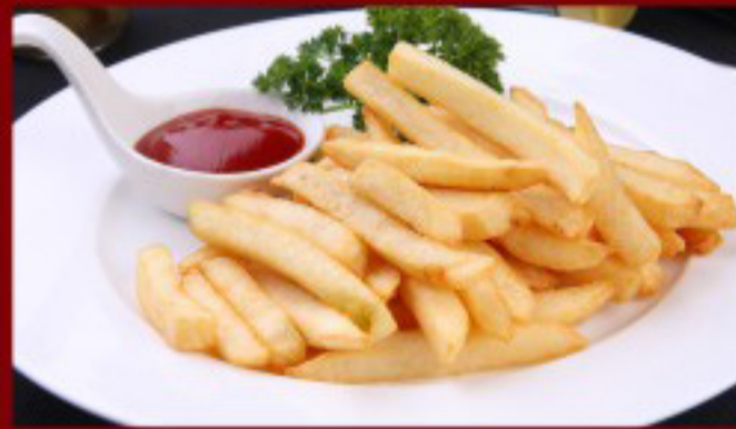
12 炸薯条 ----- 5.5 French fries Frites