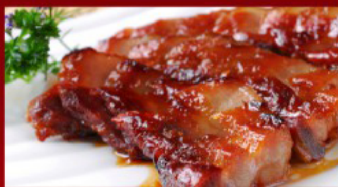
27 蜜汁叉烧 ----- 27 Honey BBQ Pork Porc BBQ au miel