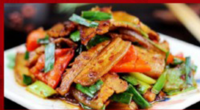
28 回锅肉 (-----) 27 Stir fry Pork belly Poitrine de porc sautée