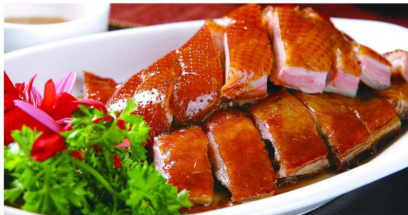
67 脆皮烧鸭 ----- 35/30(big/small) Crispy Roasted Duck Canard laqué