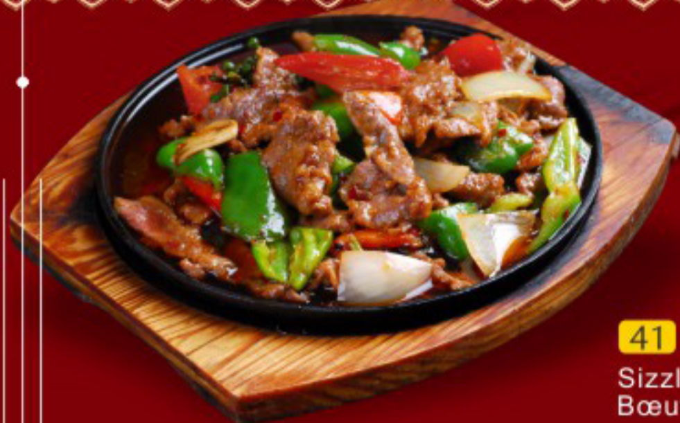
41 铁板黑椒牛 ----32 Sizzling beef with black pepper Bœuf au poivre noir sur ardoise