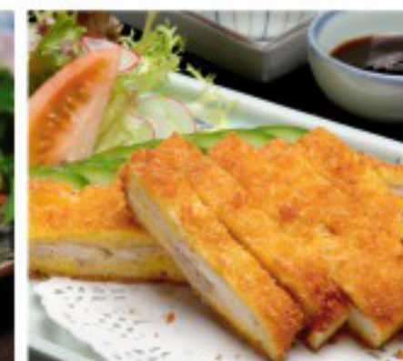
34 脆皮鸡排 Crispy chicken Poulet croustillant 26