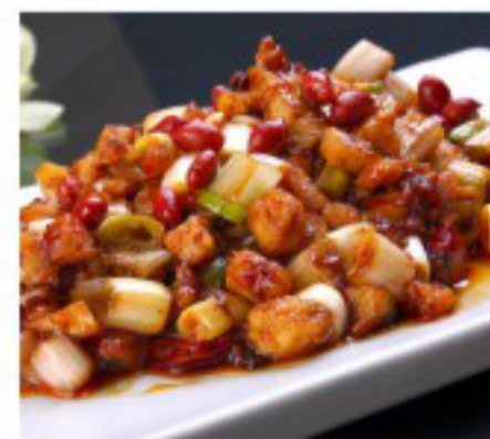
35 宫保鸡丁 ( ) Chicken Gungbao Poulet Gungbao 26