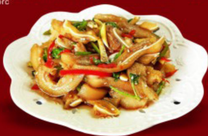
07 凉拌猪耳 ----- 12 Pig Ear Salad Salade d'oreilles de porc