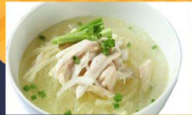
18 粉丝鸡汤 ----- 8 Vermicelli Chicken Soup Soupe de poulet aux vermicelles with Chicken