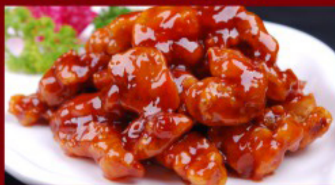
25 糖醋里脊 ----- 28 Sweet and sour pork Porc aigre-doux