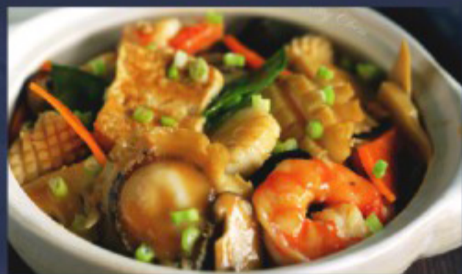
57 海鲜豆腐煲 -- 28 Tofu with seafood Tofu aux fruits de mer