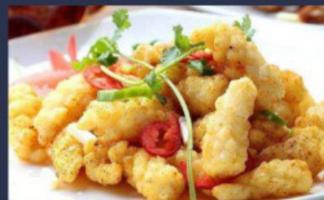
52 椒盐鱿鱼 ----- 26.5 Salt and Pepper Squid Calmars au sel et poivre

图片仅供参考·所有菜品以最终实物为准 Pictures are for reference only to all the dishes in the end in kind