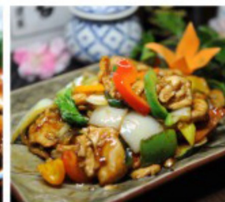
33 杂菜鸡肉 Chicken with vegetables Poulet aux légumes 26