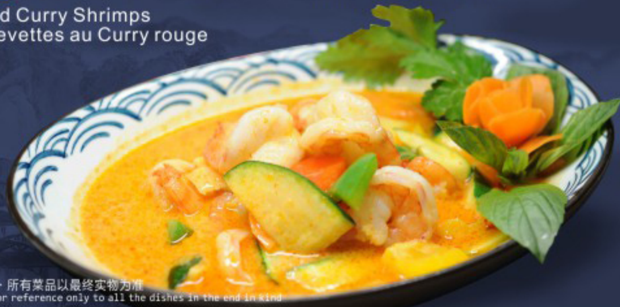
58 红咖喱虾 ----- 28.5 Red Curry Shrimps Crevettes au Curry rouge

图片仅供参考·所有菜品以最终实物为准 Pictures are for reference only to all the dishes in the end in kind