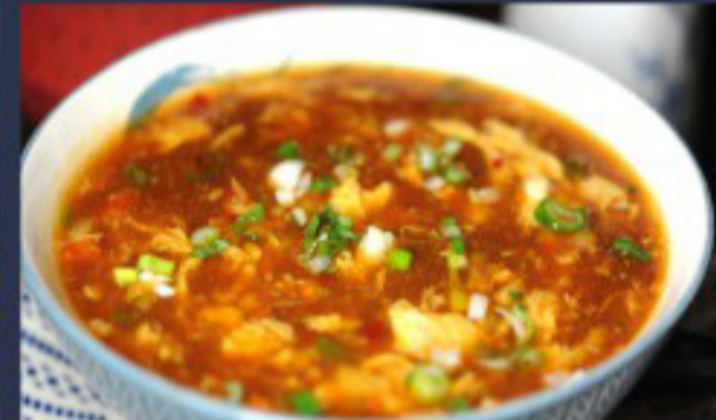
20 酸辣汤 ----- 8 Hot and sour soup Soupe aigre et piquante with Chicken