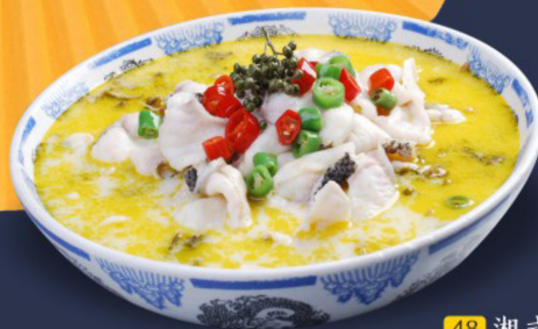
48 湘式酸汤鱼 ( ) Boiled Fish with chinese Sauerkraut Poisson bouilli à la choucroute chinoise 30

图片仅供参考·所有菜品以最终实物为准 Pictures are for reference only to all the dishes in the end in kind