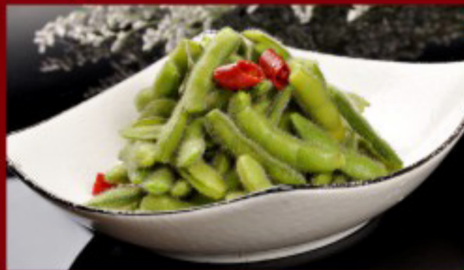
15 毛豆 ----- 8 Edamame Salade de soja