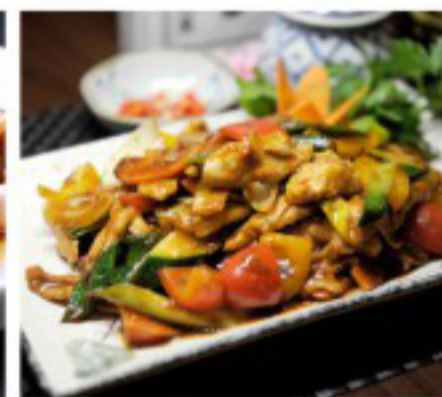
36 沙爹鸡 Chicken Satay Poulet à la sauce satay 26