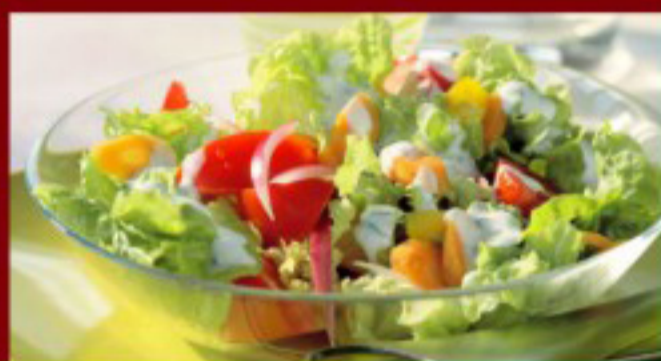
04 蔬菜沙拉 ----- 7 Mixed salad Salade mixte