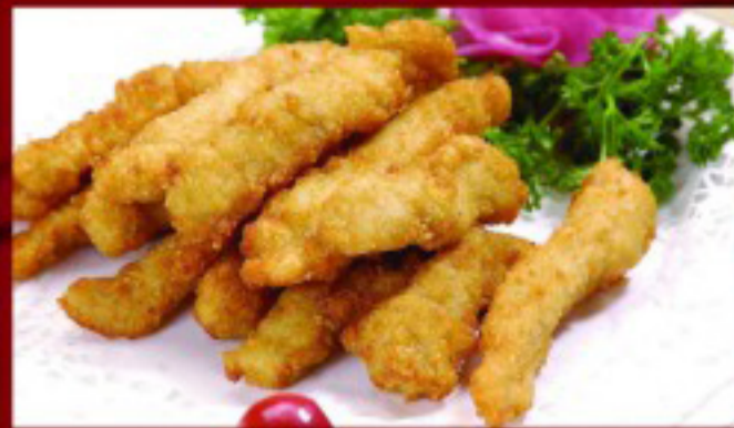
10 炸鸡柳 ----- 8 Fried Chicken Strips 6p Beignets de poulet