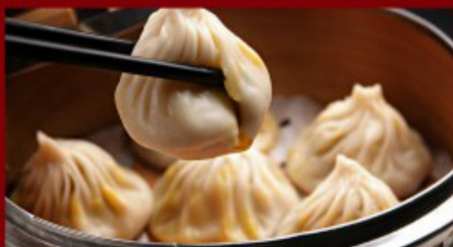
01 小笼包 ----- 10 Xiao Long Bao with pork 4p Ravioli au porc vapeur