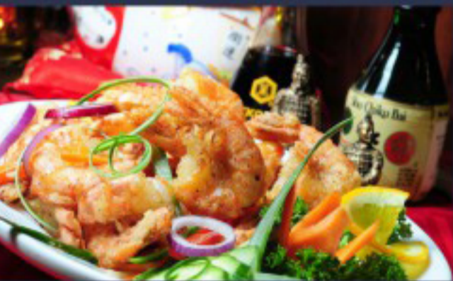
56 椒盐虾 ----- 28.5 Salt and Pepper Shrimp Crevettes au sel et poivre