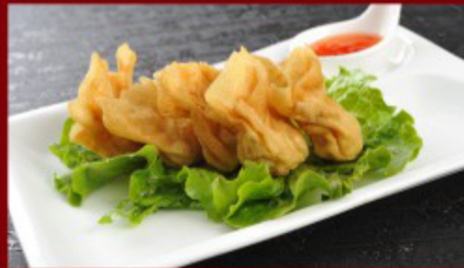
14 炸云吞 ----- 8 Raviolis frits 4p Raviolis wonton frits