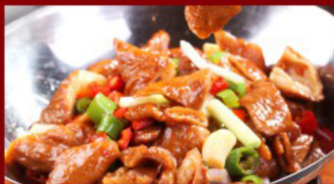
31 干锅肥肠 ----- 32.5 Pork Intestine hotpot Intestin de porc