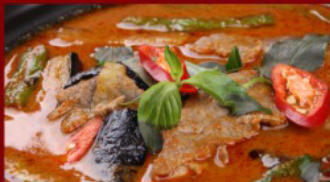
47 红咖喱牛肉 ----28.5 Red curry beef Bœuf au curry rouge

图片仅供参考·所有菜品以最终实物为准 Pictures are for reference only to all the dishes in the end in kind