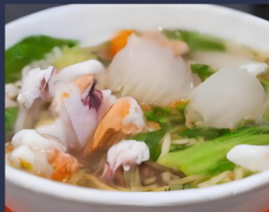
71 海鲜汤面 Noodle Soup Seafood Soupe de nouilles aux fruits de mer 28.5

图片仅供参考·所有菜品以最终实物为准 Pictures are for reference only to all the dishes in the end in kind