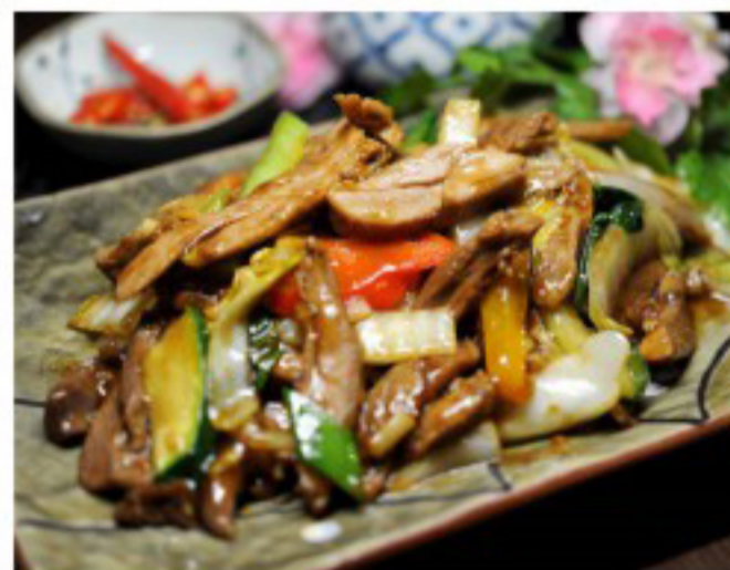
68 杂菜鸭 ----- 28.5 Duck with Vegetables Canard aux légumes