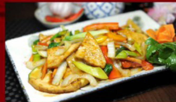
59 杂菜豆腐 ----- 25 Tofu with Vegetables Tofu aux légumes

图片仅供参考·所有菜品以最终实物为准 Pictures are for reference only to all the dishes in the end in kind