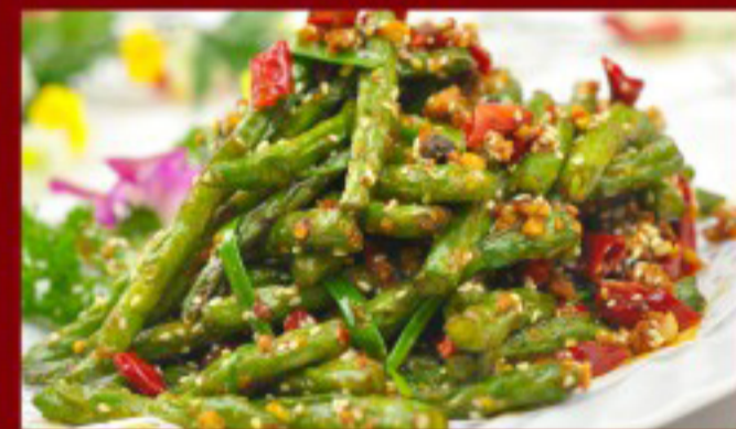
61 干煸四季豆 ----18 Fried green Beans Haricots sautés aux piments