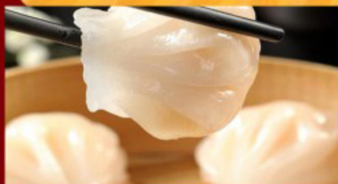
02 虾饺 ----- 10 Shrimp Dumplings 4p Raviolis aux crevettes