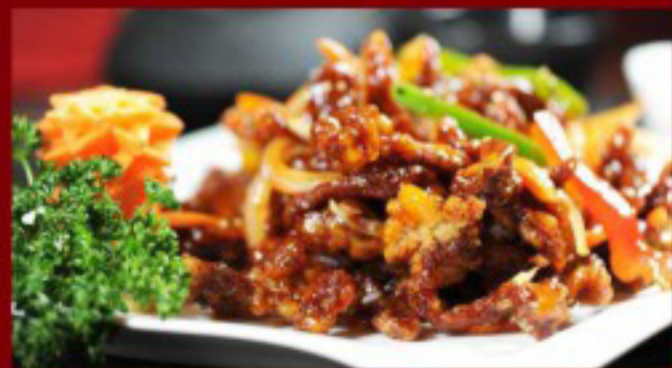
46 香脆牛肉丝 ----28.5 Crispy beef Bœuf croustillant