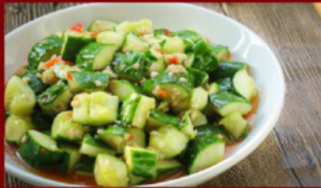
11 凉拌黄瓜 ----- 10 Cucumber Salad Salade de concombre