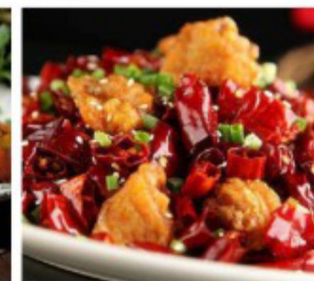
37 辣子鸡丁 ( ) Chongqing spicy fried chicken Poulet frit aux piments Chongqing 28