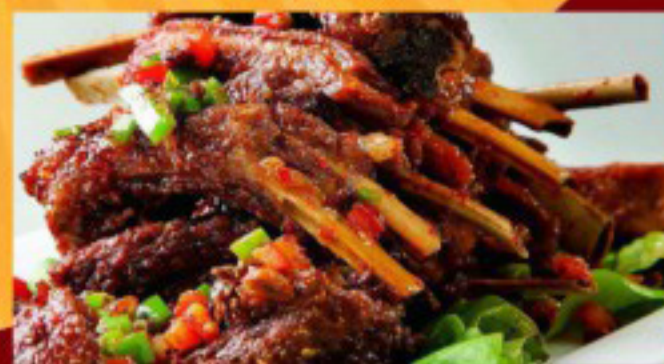
24 手撕羊排 ----- 35 Mongolian Lamb Chops Agneau Mongolie