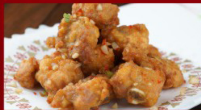
30 蒜香排骨 ----- 27 Garlic Spare Ribs Travers de porc à l'ail