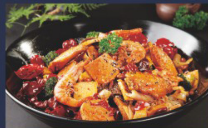
51 麻辣香锅 ( ) ----- 35 Assortment spicy seafood Assortiments des fruits de mer épicés