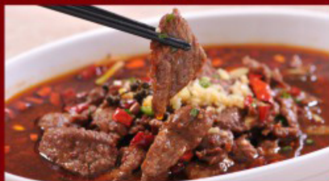
45 水煮牛 ( ) ----- 30 Boiled beef (chili oil) Bœuf bouilli (huile pimenté)