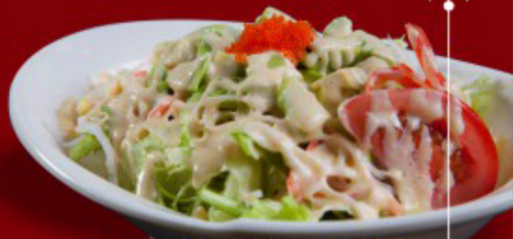
08 蟹肉沙拉 ----- 12 Crab Salad Salade de crabe