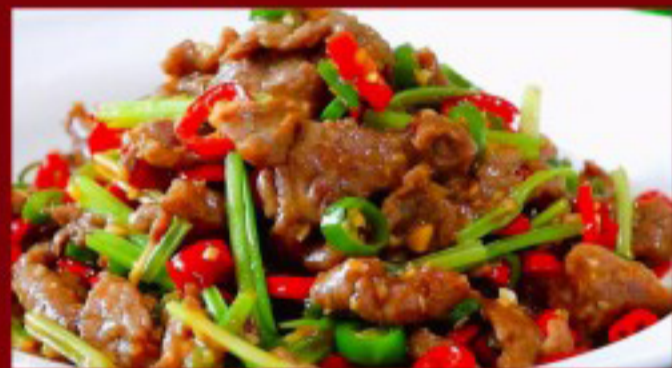
42 小炒牛 ( ) ----- 30 Red chilli beef Bœuf aux piments rouges