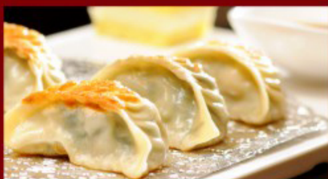
03 煎饺 ----- 10 Fried Dumplings with Porc 4p Raviolis au porc grillé