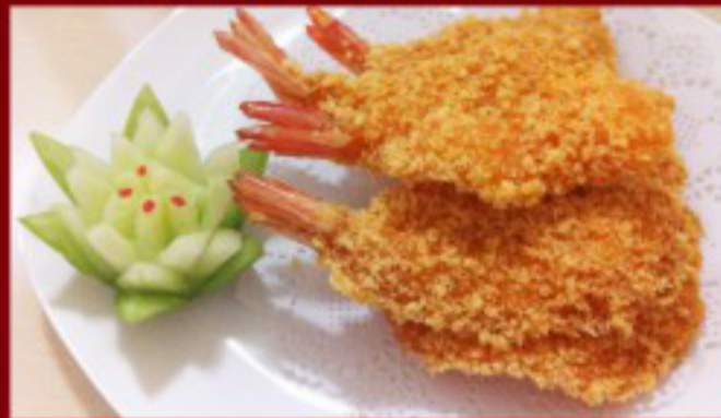
13 炸虾 ----- 10 Fried Shrimps (4p) Beignets de crevettes