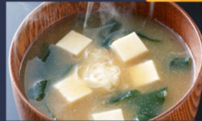
17 味噌汤 ----- 8 Miso Soup (vegi) Soupe Miso Tofu and Nori

图片仅供参考·所有菜品以最终实物为准 Pictures are for reference only to all the dishes in the end in kind