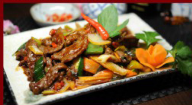
44 沙爹牛 ----- 28.5 Beef satay Bœuf à la sauce satay