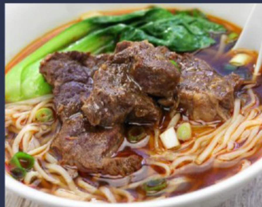
72 牛腩汤面 Noodle Soup Beef Soupe de nouilles au bœuf 28.5