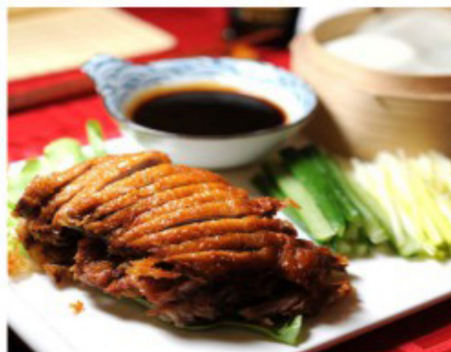
69 卷饼鸭 ----- 40 Peking Duck with pancake Canard laqué avec crêpe