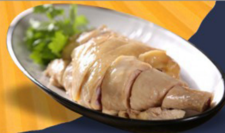
38 葱油鸡 ----- 26 Scallion oil chicken Poulet à l'huile d'oignons verts