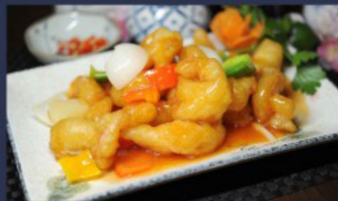
53 糖醋虾球 ----- 28.5 Sweet and Sour Shrimp Crevettes aigres-douces