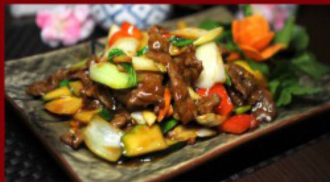
43 蔬菜牛肉 ----- 28.5 Beef with vegetables Bœuf aux légumes