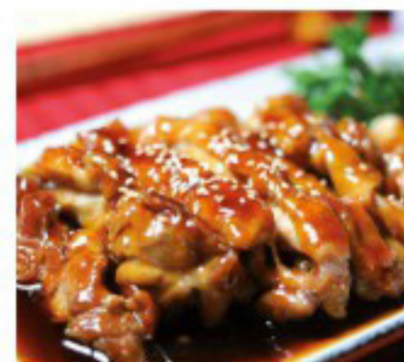
32 照烧鸡腿 Chicken Teriyaki Poulet avec sauce soja sucrée 26