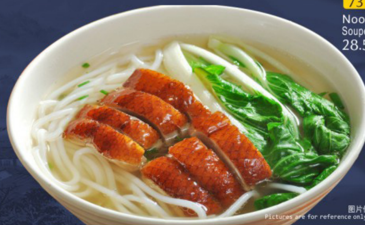
73 烧鸭汤面 Noodle Soup Duck Soupe de nouilles au canard 28.5

图片仅供参考·所有菜品以最终实物为准 Pictures are for reference only to all the dishes in the end in kind