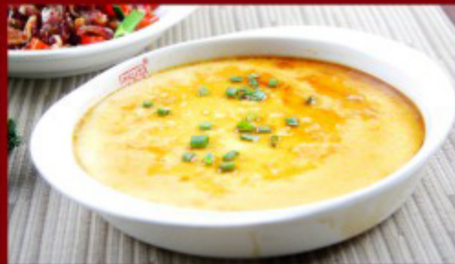
16 水蒸蛋 ----- 10 Steamed Egg Oeuf à la vapeur

图片仅供参考·所有菜品以最终实物为准 Pictures are for reference only to all the dishes in the end in kind