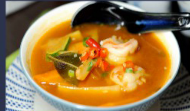
19 冬阴功 ----- 12 Tom Yum Goong Soup Soupe TomYum Gong with Shrimp