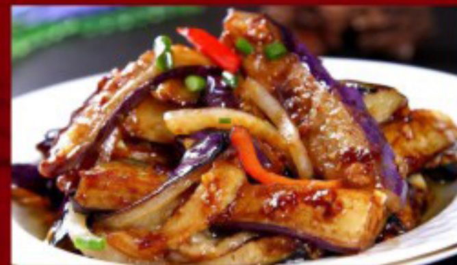
60 红烧茄子 ----- 24.5 Braised Eggplant Aubergines braisées