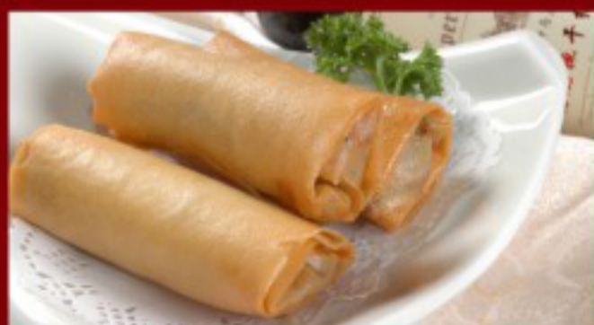
06 素春卷 ----- 7 Spring Rolls (vegi) 2p Rouleau de printemps Vietnamiens frits