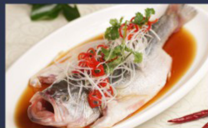
50 清蒸鲈鱼 ----- 35/45(S/M) Steamed sea bass Bar à la vapeur