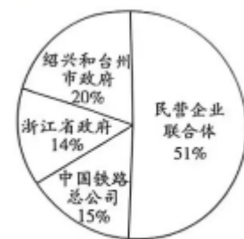
杭台高铁股权结构图

市场化改革为铁路运输系统带来了前所未有的积极变化。国有铁路企业有了更多的经营自主权，自负盈亏的营利动机更充足；多元资本的涌入倒逼铁路企业调整经营战略，改固定票价为基于市场供求的自主、灵活、优质优价的浮动票价机制，引导平衡客货流和车辆运输能力，提升运输效率；采用信息技术，积极