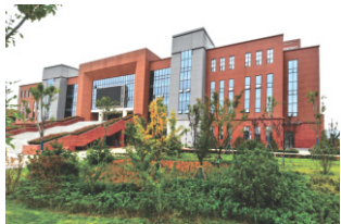
学院图书信息大厦