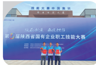
第五届陕西省国有企业技能大赛