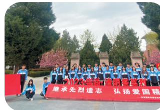
祭奠英烈清明行主题教育活动