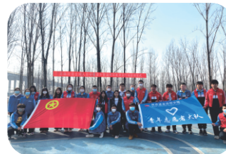
学院青年志愿者社会活动