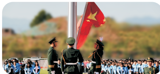
爱国主义升旗仪式