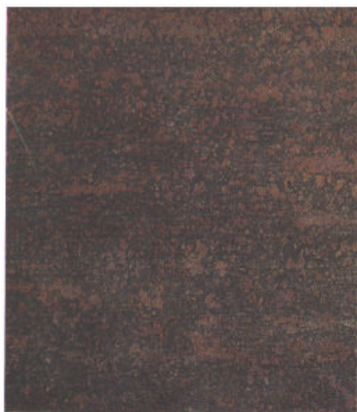
B Sa 1