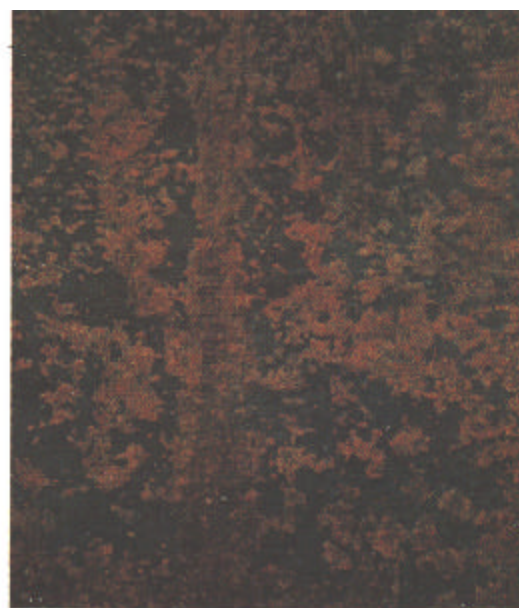
B St 3