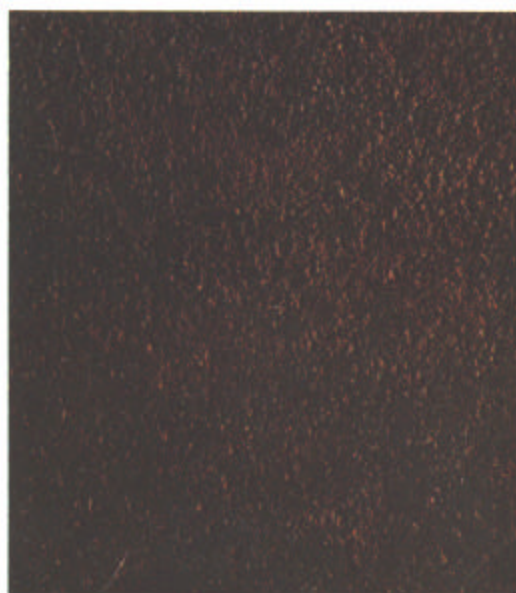
D St 3