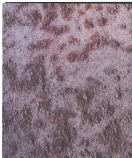
D Sa 2