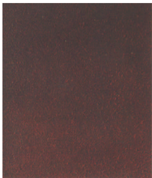
C Sa 1