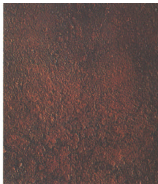
D St 2