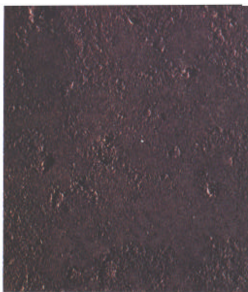
D Sa 1