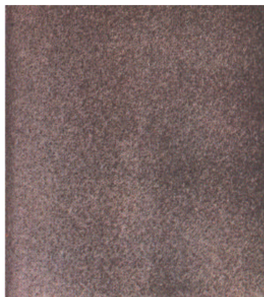
C Sa 2