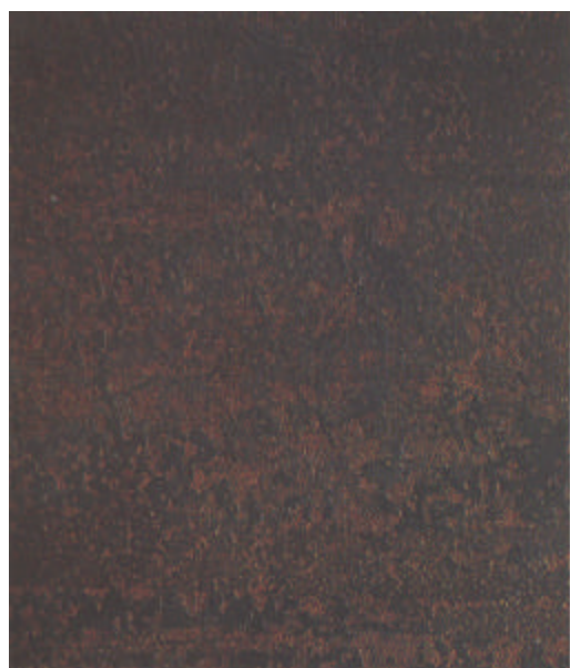
B St 2