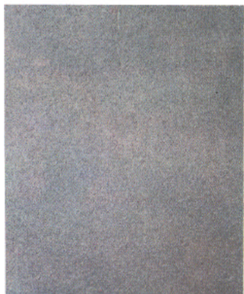
A Sa 3