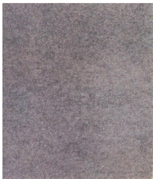
A Sa 2½