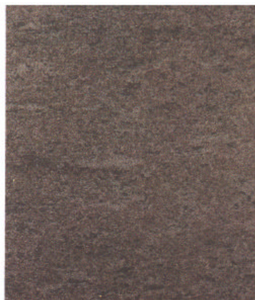
B Sa 2