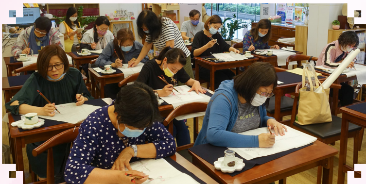
文/緣真 圖/曾慧冰、何鳳凌