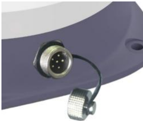
图 2 12G-6P 航空公头

与车载终端的连接接口： 车载终端连接器插座型号为 12G-6P 防水航空插头公头，连接线插头型号为 12G-6A 防水航空插头母头，如图 2、图 3 所示。