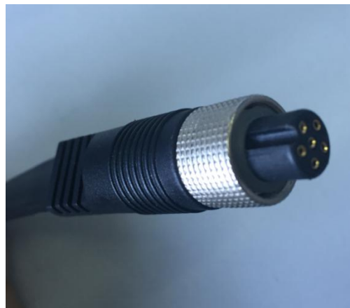
图 12G-6A 航空母头

车载终端航空公头的电气接口说明如下表所示，需要 RS485/RS422 请咨询本公司：