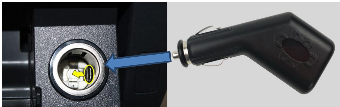
图 5 电源插座与车载点烟器

连接线插头的另一端为车载点烟器（枪型），可适用于内径 21mm 的电源插座。为了方便客户测试、使用，默认发货线长为 5 米，如有特殊说明请与我司联系。