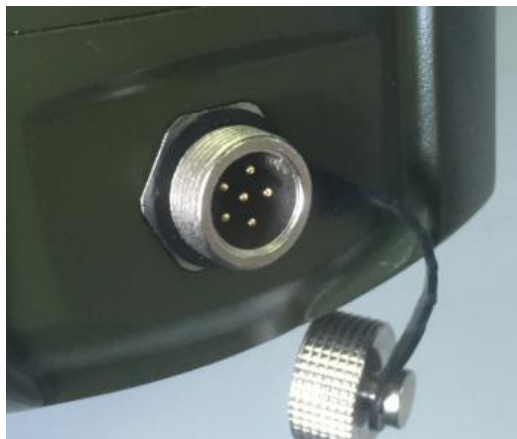
图 12G-6P 航空公头

与车载终端的连接接口：车载终端连接器插座型号为 12G-6P 防水航空插头公头，连接线插头型号为 12G-6A 防水航空插头母头，如图 3、图 4 所示。