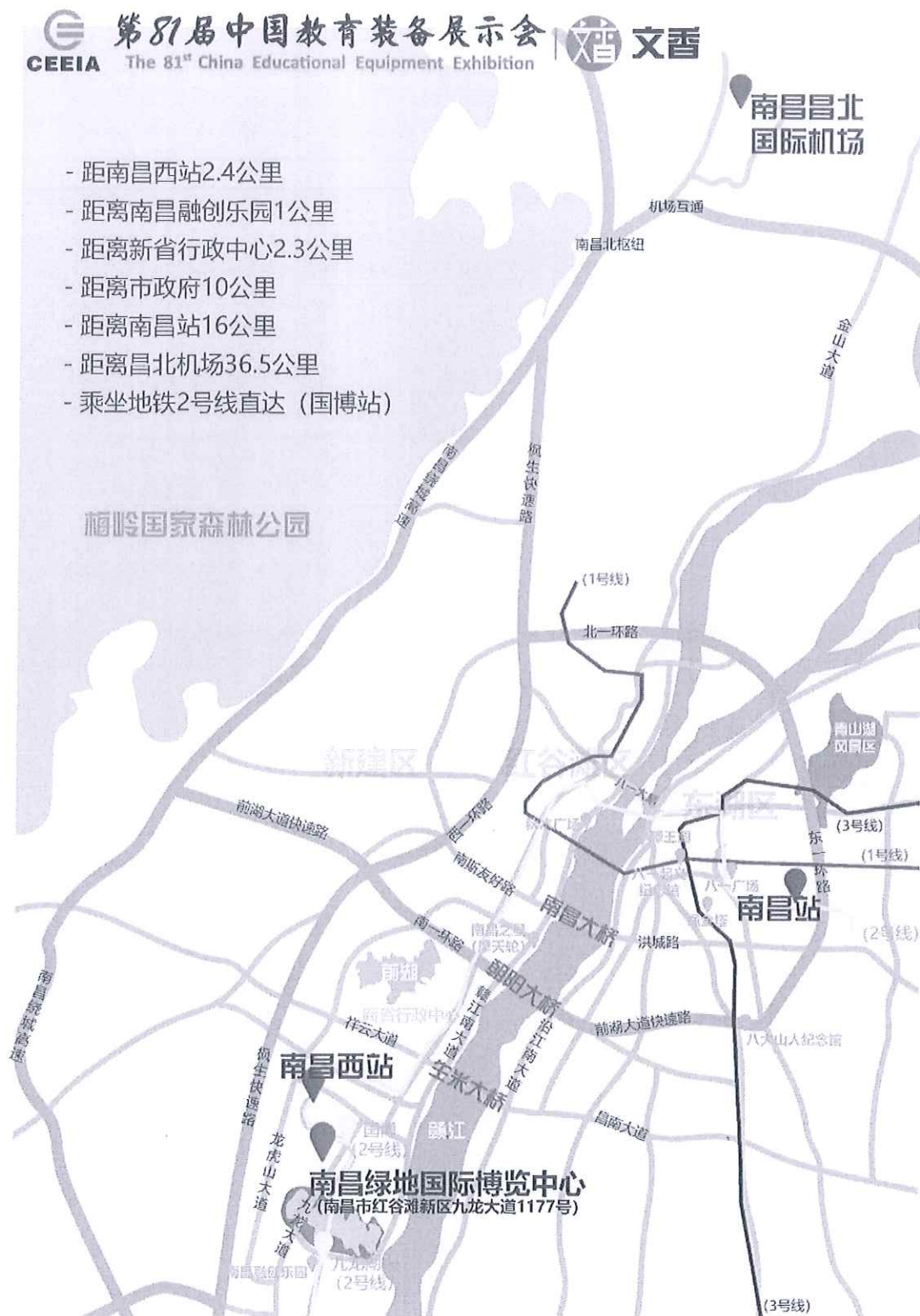
酒店及交通示意图