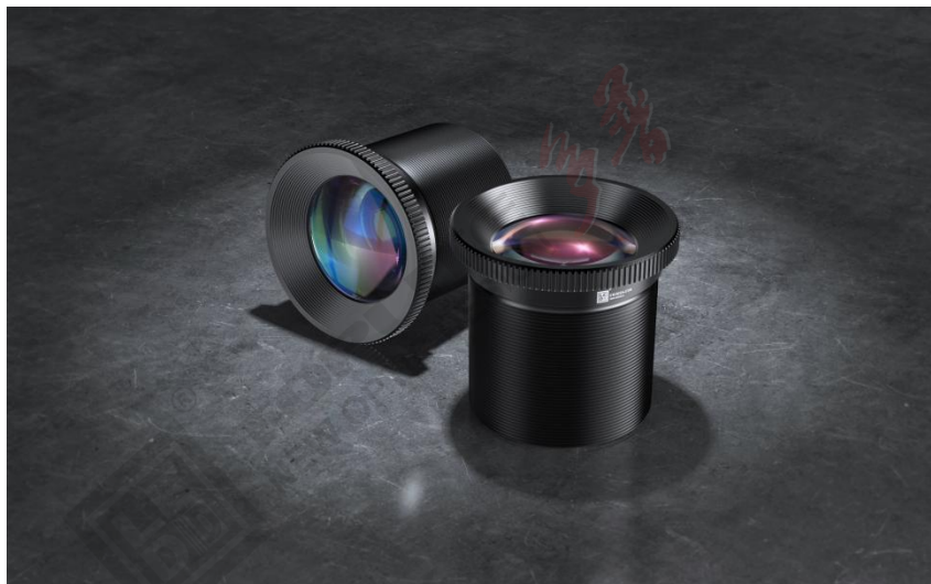
图 1: IMM28-F25 外观

IMM28-F25 是一款成像投影用广角镜头。采用该镜头光学方案的光路短，使得照明器具等产品变得容易小型化。镜头投射的光斑成像清晰、均匀。可应用于水纹、落叶、飘雪等效果灯、图案灯、投影灯等。