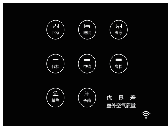
WiFi86触摸控制器 可选配空气使者智能控制