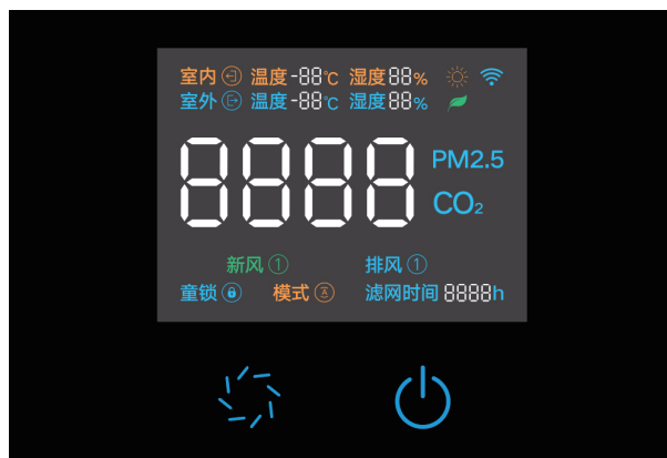
TFT真彩触控显示屏 触摸控制+遥控控制+手机控制