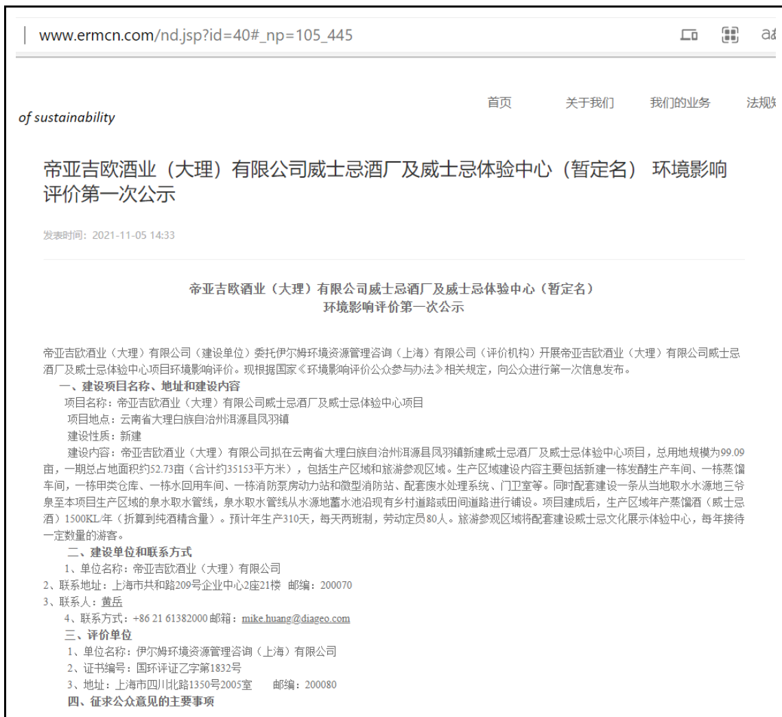
图 2.2-1 第一次网上公示截图（部分）