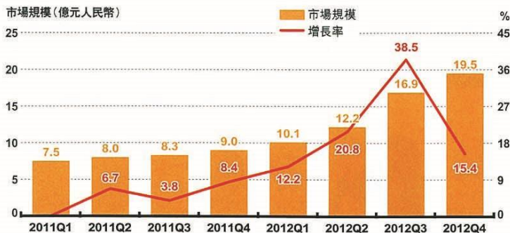
圖一 中國手機遊戲市場規模狀況

※艾媒諮詢 (iiMedia Research) 指出，2012年中國手機遊戲市場規模58.7億人民幣（約10億美元），較前一年（2011）增長約79%。 ※預計於2013年底，手機遊戲的逐年增長率會達110%，達至約100億人民幣（約16億美元）。