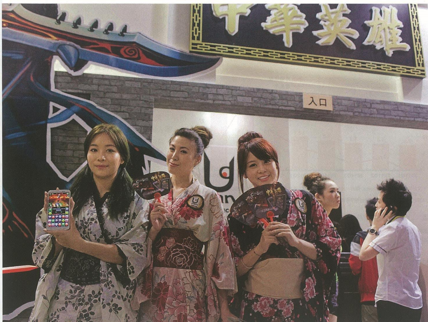
▲在香港動漫電玩節推廣本土手機遊戲的模特兒