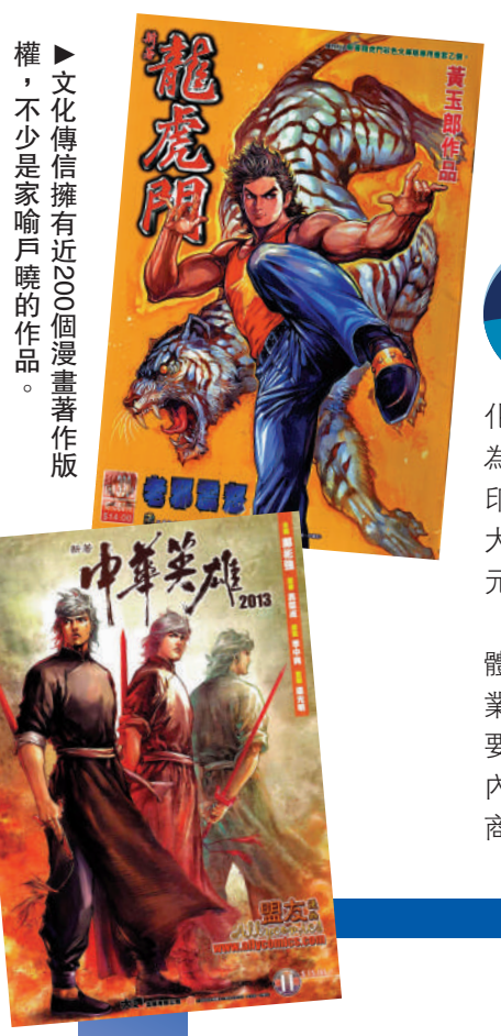
文化傳信擁有近200個漫畫著作版權，不少家喻戶曉的作品。