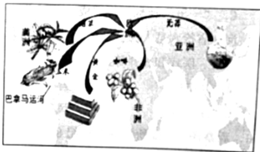
图 2 16 世纪人类财富大规模流向欧洲示意图

材料二 20世纪初，随着横贯南美大铁路的建成，全球五大洲布满了铁路网。1914年竣工的巴拿马运河使美国旧金山到英国利物浦的航路缩短了566英里，这一时期，全世界已有200万辆汽车奔驰在交通运输线上。