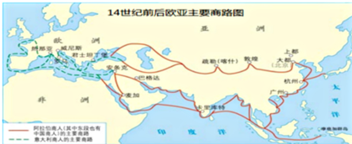
图 1 14 世纪欧亚大陆主要商路示意图