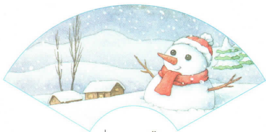
dōng xuě 冬雪

chūn fēng chuī xià yǔ luò qiū shuāng jiàng dōng xuě piāo 春风吹 夏雨落 秋霜降 冬雪飘