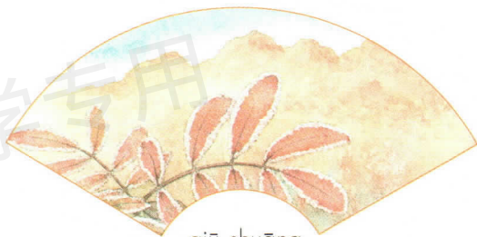
qiū shuāng 秋霜