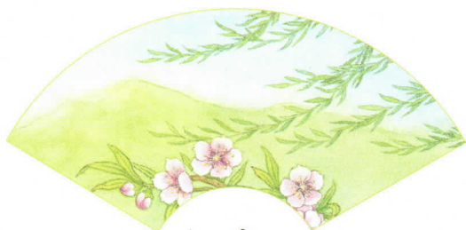
chūn fēng 春风