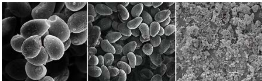
地上皇灵芝孢子粉破壁显微镜

灵芝孢子粉，是灵芝的种子。破壁灵芝孢子粉，是运用现代技术碾碎孢子粉外壳，使之易于吸收。破壁灵芝孢子粉价格比灵芝子实体要贵，是因为灵芝孢子粉的功效与作用好，且产品低所致。